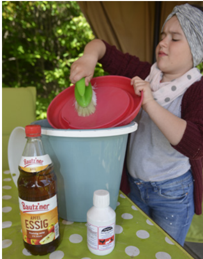
Regelmäßig sollten die Tränken gereinigt werden.

Verdauungssystem unserer Tiere nachteilig auswirken kann. Natürlich sollte zu einer Tränken Hygiene auch ein tägliches reinigen der Tränke von Schmutz, Ansätzen auf den Tränkenboden gehören. Gerne darf auch einmal in der Woche mit Desinfektionsmittel angereichtert werden um die Tränke keimfrei zu machen. Die Tränken keimfrei zu machen geht auch ohne chemische Zusätze. Ganz einfach mit Wechseltränken. So hat man pro Stall immer zwei Tränken. Die Erste ist