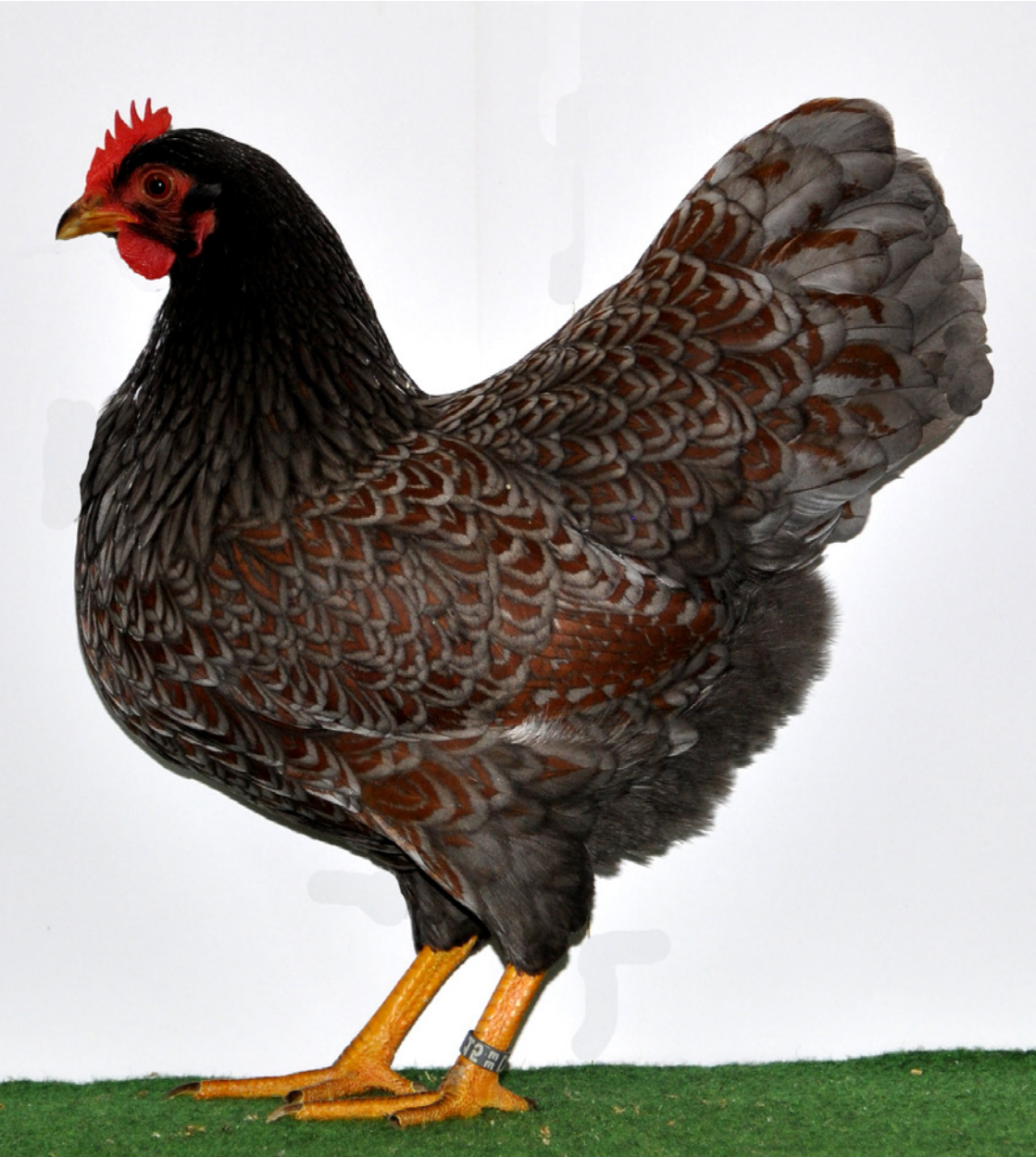
0,1 Zwerg-Barnevelder, braun-blaudoppeltgesäumt, sg 94 Z, Züchter Ralf Elfers