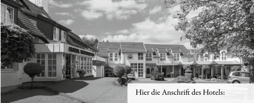
Hier die Anschrift des Hotels:

Liebe Freude der Barnevelder und Zwerg Barnevelder, sehr geehrte Gäste!