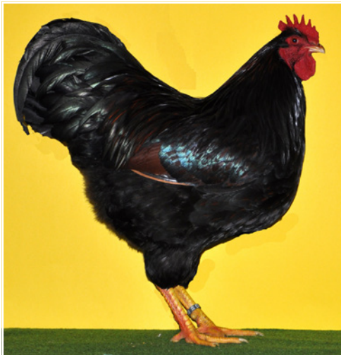
1,0 Barnevelder braun-schwarzdoppeltgesäumt, v 97 Ba-Band Züchter Ludger Alfes