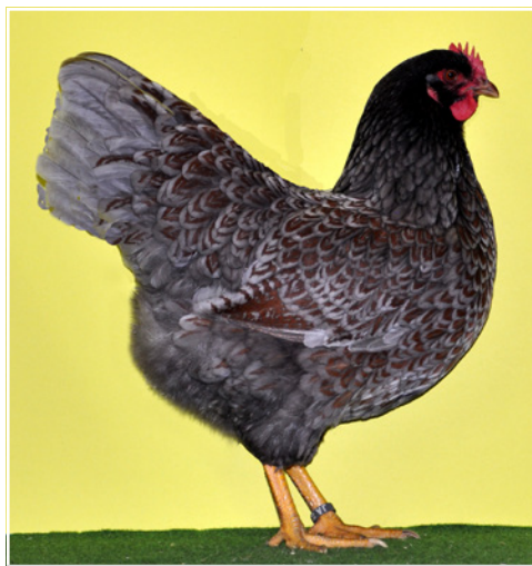
0,1 Barnevelder braun-blau-doppeltgesäumt, sg 95 Z Züchter Georg Zellmer

Bei den Hennen waren Standhöhe, Grundfarbe, Lauffarbe, Kopfpunkte und Flügellage hervorzuheben. Verbesserungswürdig und somit als Wunsch wurden vermerkt: Mehr Brustfülle und Tiefe, hohler im Anstieg, fertiger im Abschluss. Auch muss auf das Zeichnungsbild der Halszeichnung geachtet werden. Es ähnelte teilweise der Farbe der New Hampshire. Die höchste Be-