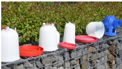
Sonnenstrahlen sind besser als Desinfektionsmittel - Wechseltränken haben sich bestens bewährt.

Verdauungssystem unserer Tiere nachteilig auswirken kann. Natürlich sollte zu einer Tränken Hygiene auch ein tägliches reinigen der Tränke von Schmutz, Ansätzen auf den Tränkenboden gehören. Gerne darf auch einmal in der Woche mit Desinfektionsmittel angereichtert werden um die Tränke keimfrei zu machen. Die Tränken keimfrei zu machen geht auch ohne chemische Zusätze. Ganz einfach mit Wechseltränken. So hat man pro Stall immer zwei Tränken. Die Erste ist