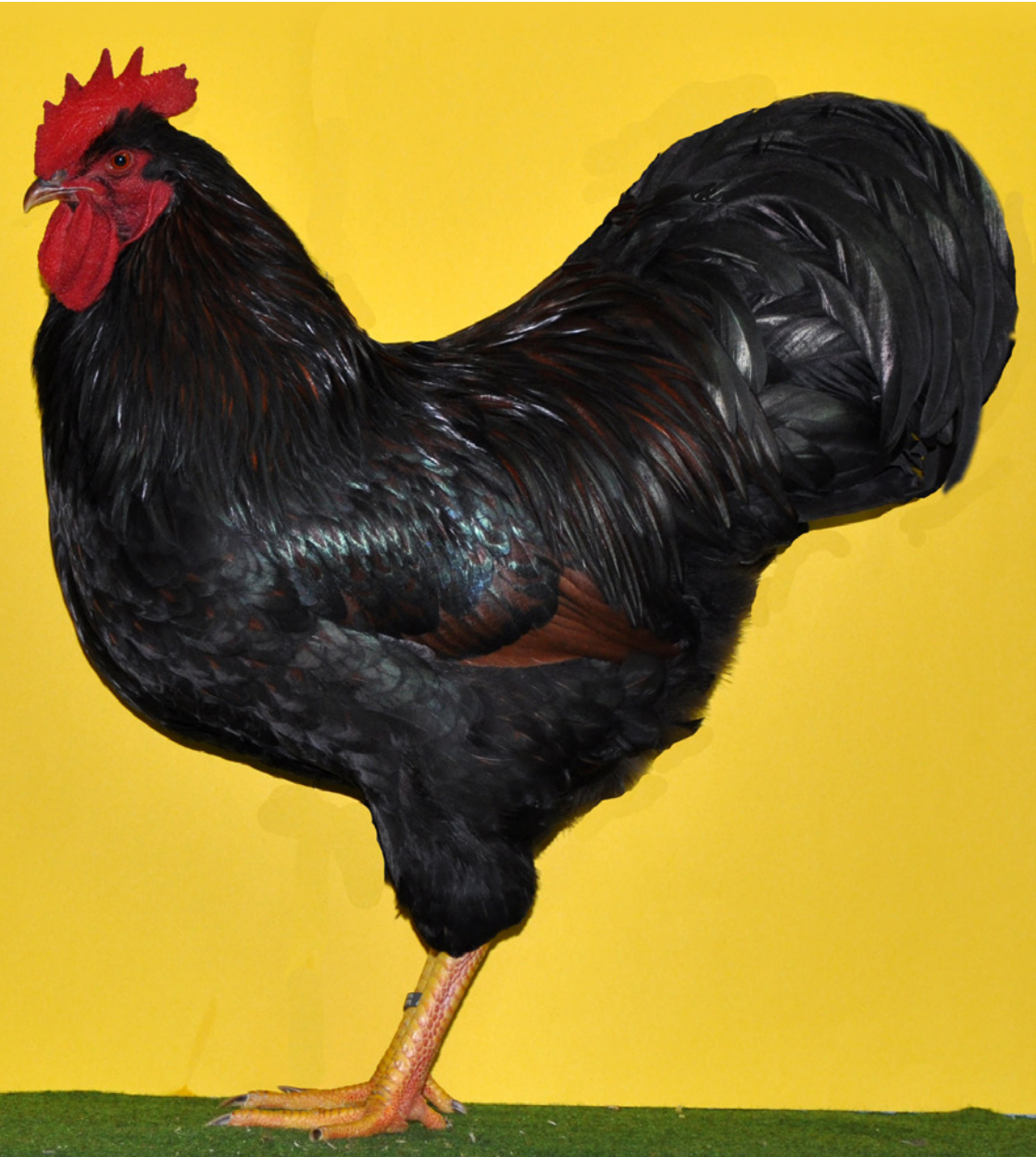
1,0 Barnevelder braun-schwarzdoppeltgesäumt, hv 96 E, Züchter Daniel Berghorn