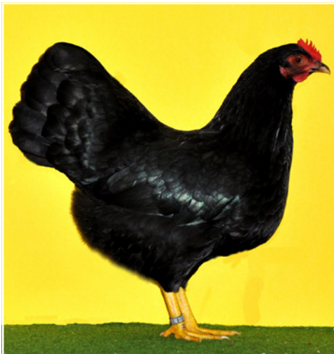
0,1 Zwerg-Barnevelder schwarz,