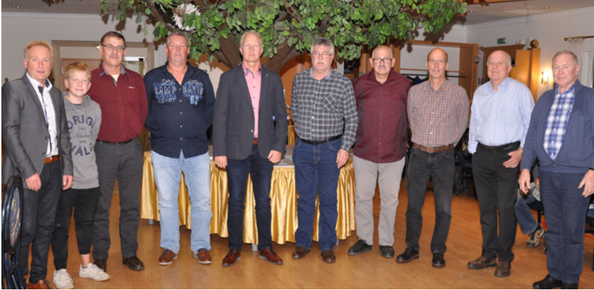
Die Erringer der Barnevelder Bänder 2020 von Effelder.

be, Rückenpolster sowie Einfachsäum hauptsächlich auf den Flügeldecken konnten kein sg mehr erreichen. Abschlussfehler waren Spaltfeder, doppelt unterlegte Handschwinge und fehlende Federfahne in den Steuerfedern.