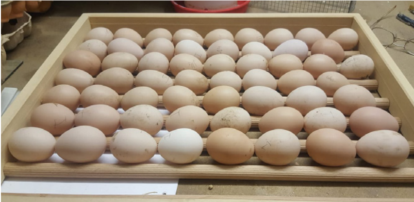
Sauberes Einstreu bringt auch saubere Bruteier. Was für die Schlupfquote von großen Vorteil ist.

absolut trocken gelagert werden. Durch Eintritt von Feuchtigkeit im verpackten Material können sich Pilzsporen bilden, die man mit dem bloßen Auge nicht erkennt. Ein Geruchstest beim Öffnen der Verpackung kann hier helfen. Gerade unsere Küken und Jungtiere reagieren auf solche Erreger sehr sensibel. Was Krankheiten bei Organen im Luftbereich verursacht, kann bis zum Tod der Jungtiere führen.