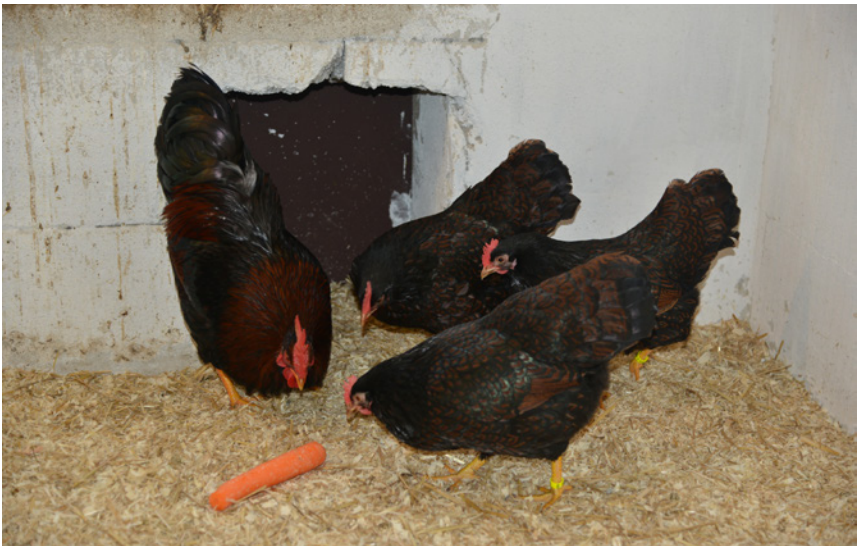
Stroh, Sand oder Holzspäne, diese sind die beliebtesten Einstreuvarianten unserer Rassegeflügelzüchter.

Hobelspäne eine längere Verrottungsdauer haben als normale Gartenabfälle. Hier kann das seit gut 10 Jahren in den Markt gekommene Hanfstreu schon viel bessere Eigenschaften vorweisen. Gerade in Hinblick auf die Bindung von Feuchtigkeit im Stallklima hat Hanf wohl die höchsten Bindeeigenschaften. Gerade in den Wintermonaten habe ich mit Hanfstreu beste Erfahrungen gemacht, um ein gutes und vor allem trockenes Stallklima zu erhalten, was auch am frischen Eigengeruch dieses Materials liegt. Die seit einigen Jahren am Markt angebotene Dinkelstreu habe ich leider selber noch nicht getestet. Aber mir bekannte Züchter konnten die gleichen Eigenschaften wie des Hanfes bescheinigen. Ich möchte hier auch nicht unerwähnt lassen, dass bei diesen drei genannten Einstreumaterialien ein wichtiger Punkt eingehalten werden muss. Diese Materialien müssen