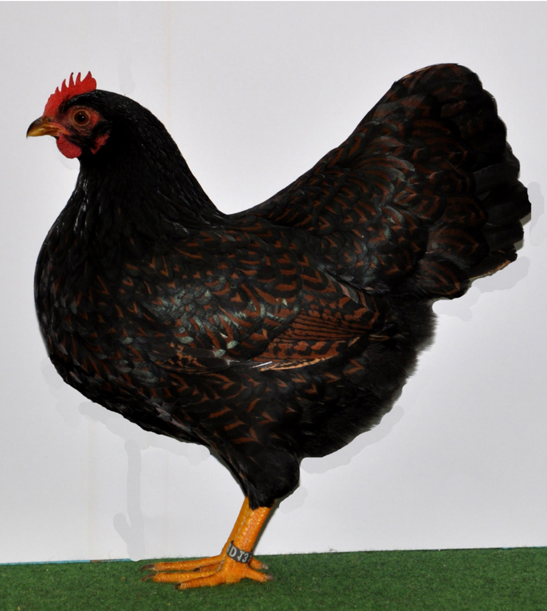
0,1 Zwerg-Barnevelder, braun-schwarzdoppeltgesäumt, hv 96 E, Züchter Ralf Elfers