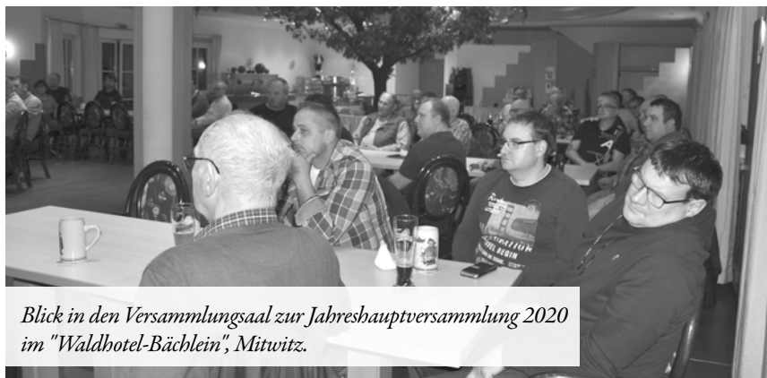
Blick in den Versammlungsaal zur Jahreshauptversammlung 2020 im "Waldhotel-Bächlein", Mitwitz.