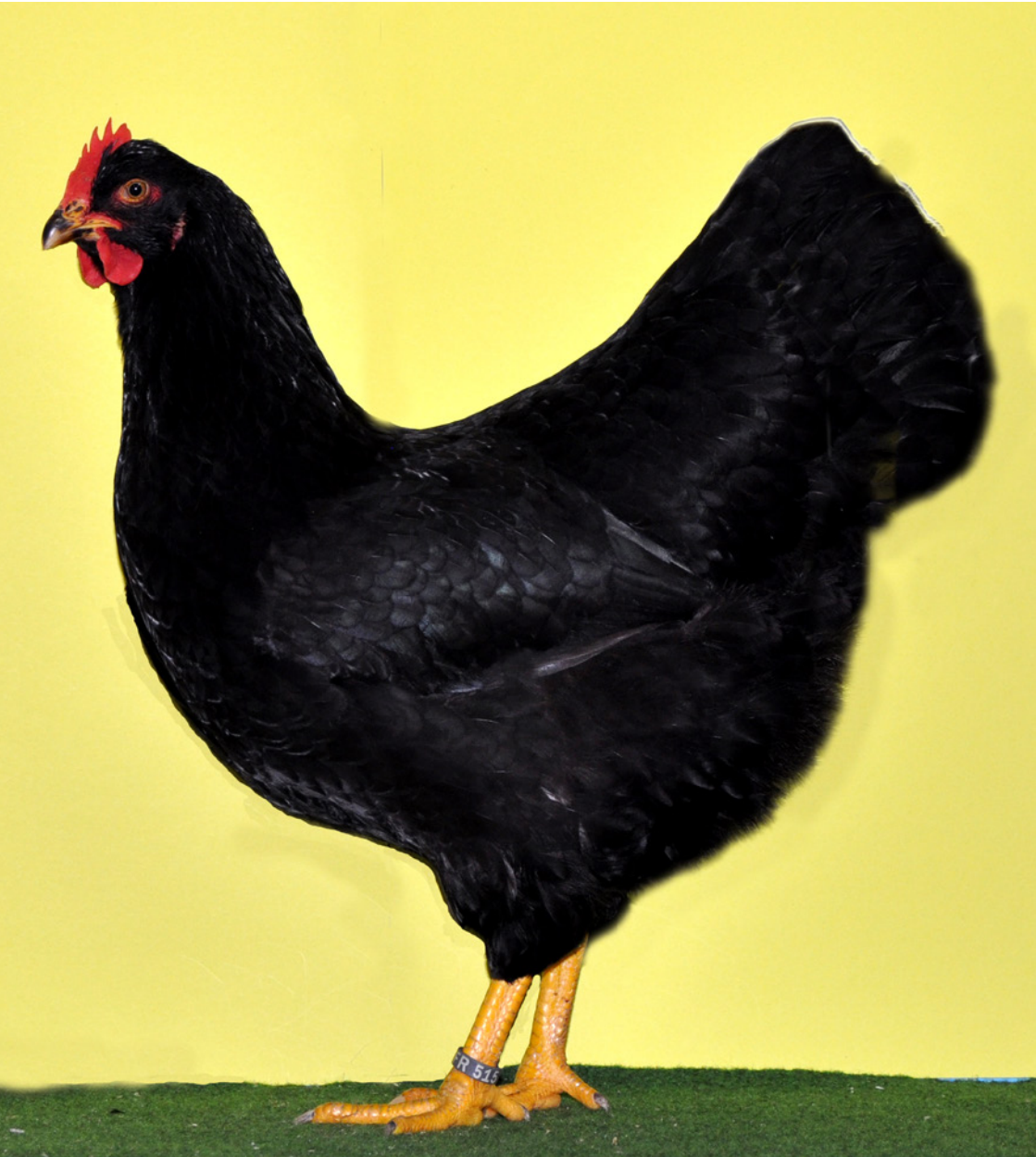
0,1 Barnevelder, schwarz, hv 96 LVEBY, Züchter Waldemar Müller