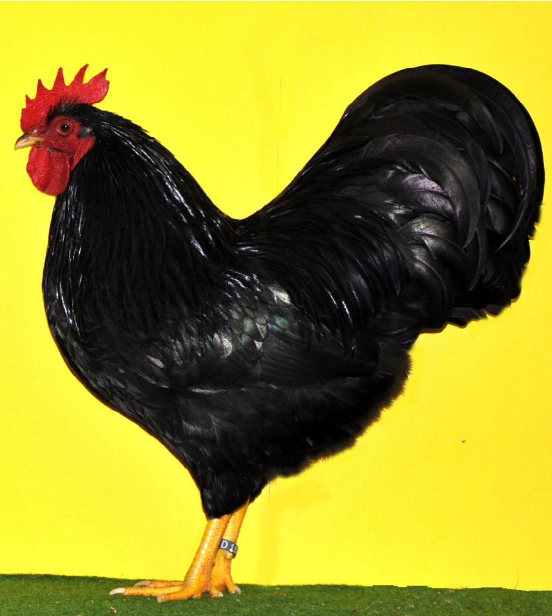
1,0 Zwerg-Barnevelder, schwarz, hv 96 E, ZG Homrighausen