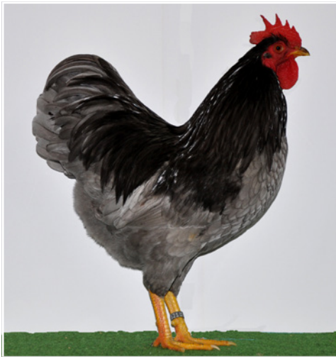
1,0 Zwerg-Barnevelder AOC blau, hv 96 E BVP Züchter Heinrich Brockmüller

Die 19 ausgestellten Tiere in blau haben uns alle in der Meldezahl und Qualität völlig positiv überrascht. Bewertet wurden sie von Rolf Wesp. Die gezeigten Hähne verkörperten alle eine ansprechende Form und eine sehr gute Grundfarbe. In der Behangfarbe gab es Unterschiede. Braune Einlagerungen wurden gestraft. Leider hatte ein schöner 1,0 einen Doppelzacken im Vorkamm, welcher mit der Note „U“ bewertet wurde. Die beiden schönsten Tiere, ein Hahn und eine Henne waren schon klasse. Beide wurden mit hv 96 Punkte bewer-