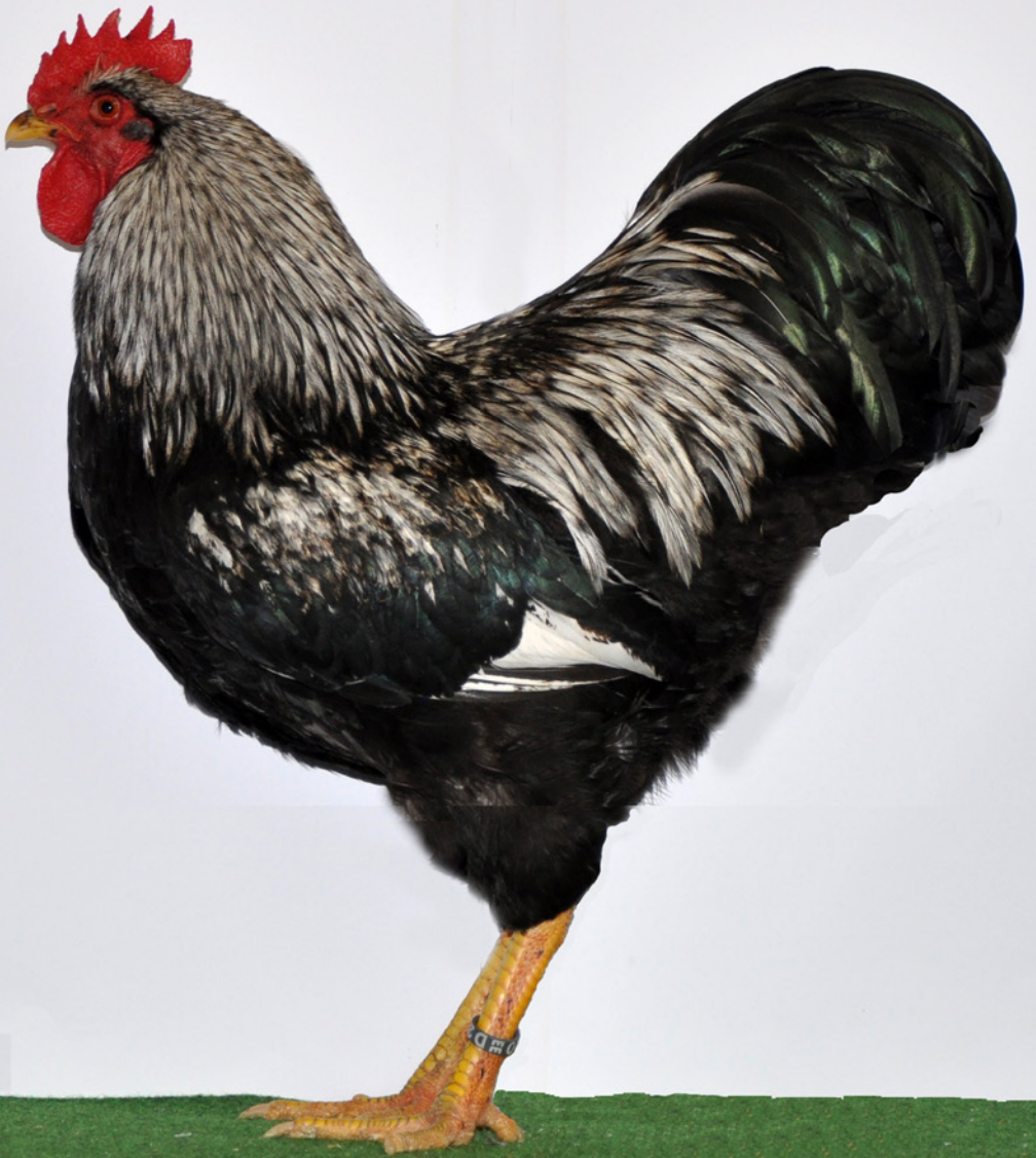
1,0 Barnevelder, silber-schwarzdoppeltgesäumt, hv 97 LVETH, Züchter Helmut Schulze