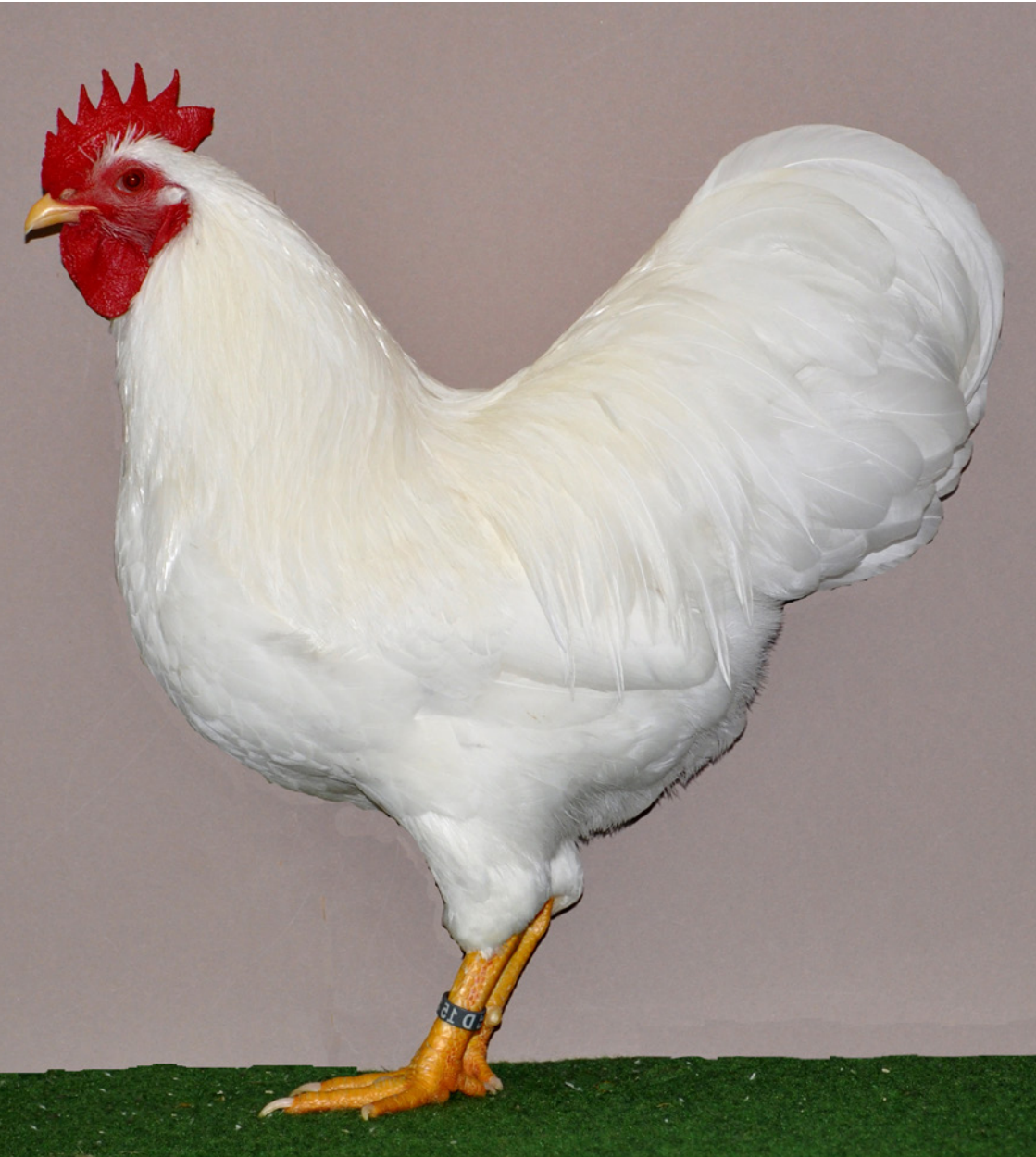
1,0 Zwerg-Barnevelder weiß, v 97 EB, Züchter Tim Massing