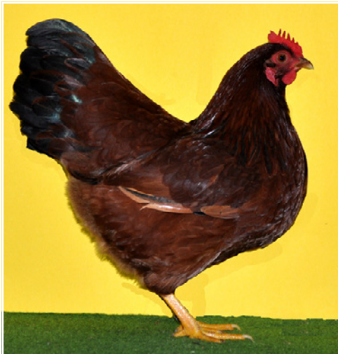
0,1 Zwerg-Barnevelder dunkelbraun, v 97 Ba Band Züchter Erwin Neid

Die Hennen-Kollektion präsentierte sehr harmonisch in Form, Farbe und blauer Doppeltäumung. Die V-Henne zeigte Ralf Elfers. Derselbe und die ZG Wesp/Klart zeigten noch jeweils eine Henne mit hv 96 Punkte. Einzelne Hennen hatten Defizite in der blauen Innensäumung. Es muss darauf geachtet werden, dass die Innensäumung scharf abgegrenzt bleibt und nicht verdrängt wird.