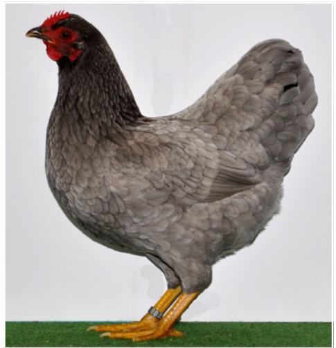
0,1 Zwerg-Barnevelder AOC blau, hv 96 E Züchter Heinrich Brockmüller