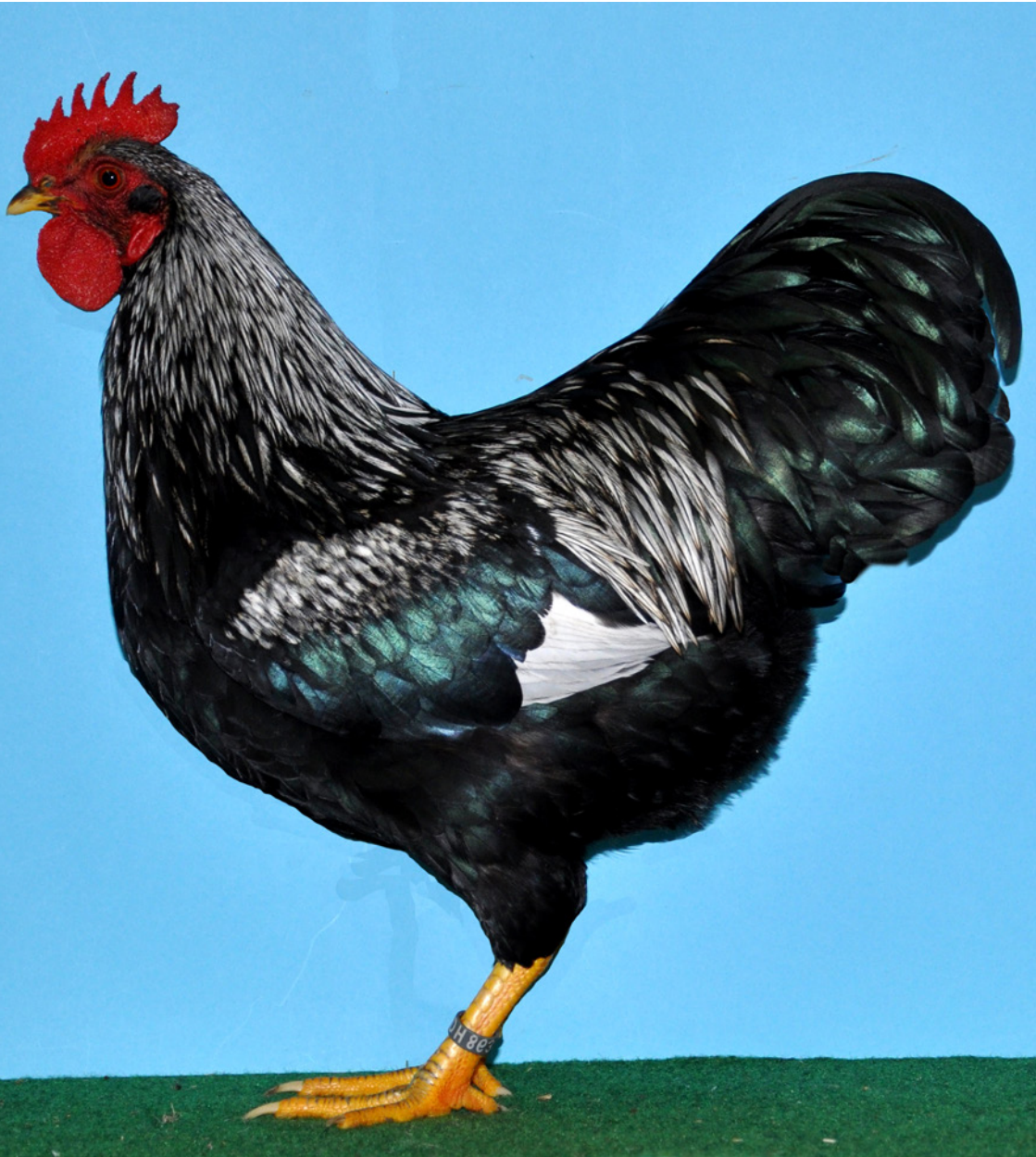
1,0 Zwerg-Barnevelder, silber-schwarzdoppeltgesäumt, hv 96 SE 58, Züchter Franko Rödiger