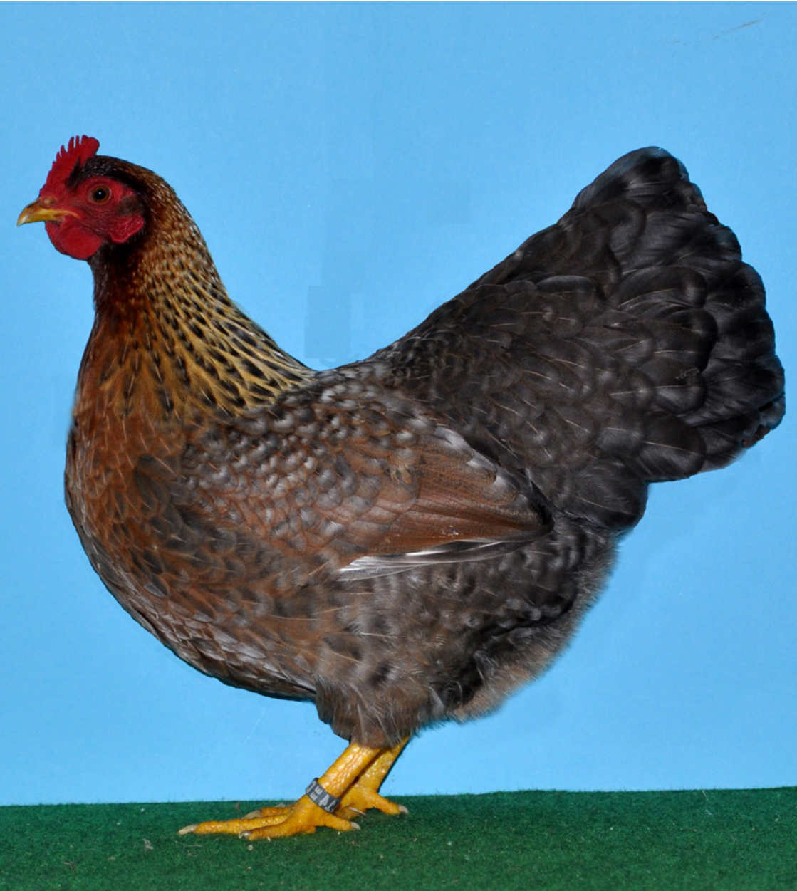
0,1 Zwerg-Barnevelder kennfarbig, v 97 BaBd, Züchter Günter Zanner