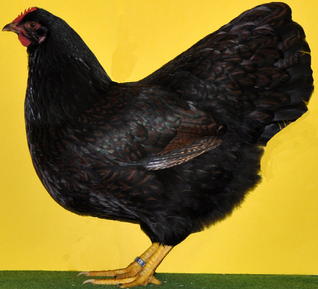
0,1 Barnevelder braun-schwarzdoppeltgesäumt, v 97 Ba-Band, Züchter Ludger Alfes