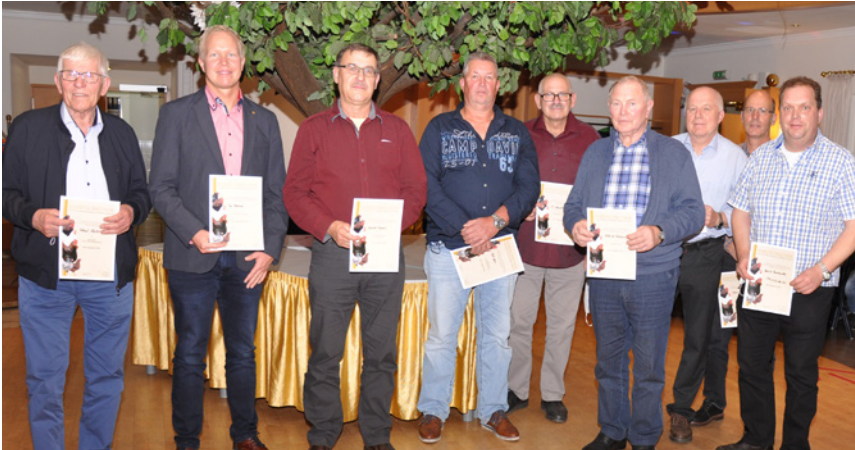
Die Erringer der Champions Titel 2020.