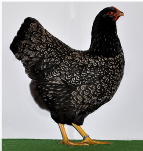
0,1 Barnevelder silber-schwarzdoppeltgesäumt, sg 95 RE, Züchter Marcel Weber

be, Rückenpolster sowie Einfachsäum hauptsächlich auf den Flügeldecken konnten kein sg mehr erreichen. Abschlussfehler waren Spaltfeder, doppelt unterlegte Handschwinge und fehlende Federfahne in den Steuerfedern.